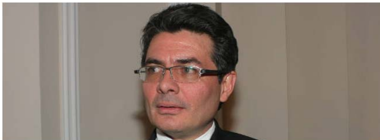
Alejandro Gaviria se posesionó como nuevo Ministro de Salud y Protección Social A lo largo de su carrera, ha publicado al menos 48 papers y ha escrito y editado ocho libros.